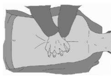
Nadgarstek drugiej ręki ułóż na już położonym

° spleć palce obu dłoni i upewnij się, że nie będziesz wywierać nacisku na żebra poszkodowanego; nie uciskaj nadbrzusza ani dolnego końca mostka,