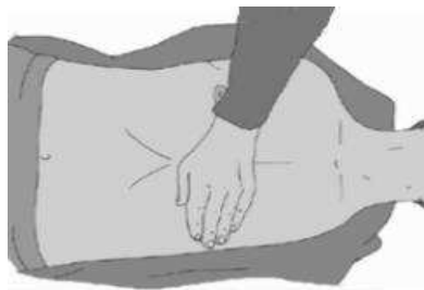
Ułóż nadgarstek jednej ręki na środku klatki piersiowej

° ułóż nadgarstek drugiej ręki na już położonym,